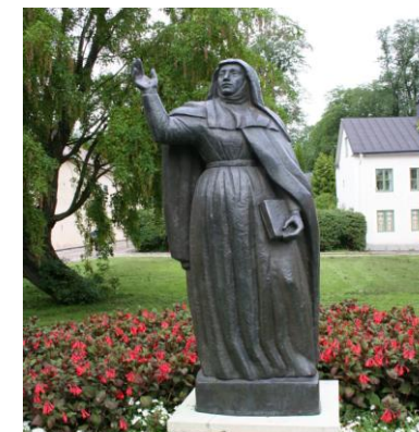
Birgittaforeningen i Mariager