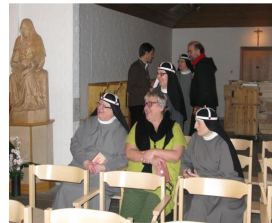
Billedet er fra Birgittasøstrenes kirke.

Søndag formiddag vil der være mulighed for at deltage i en katolsk messe eller svenska kyrkans messe, inden afrejse mod Gøteborg/ København.