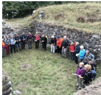
Pilgrimme ved Ulfåsa borgruin

Udover daglige vandringer i og omkring Vadstena blev der her også fortalt om - og vist billeder fra – flere historiske steder, som gruppen havde besøgt, hvor der stadig findes synlige levninger fra f.eks. middelalderborgen ”Ulfåsa”, hvor Birgitta af Vadstena levede en del af sin tilværelse for ca. 700 år siden. Det var et meget spændende og interessant foredrag der gav inspiration til, at Birgittaforeningen snart igen inviterer til en rejse til Mariagers ”åndelige moderby”