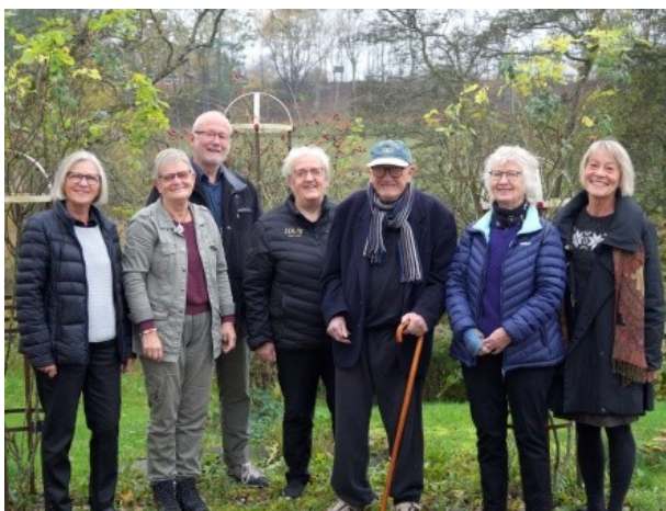
Birgittaforeningens bestyrelse med suppleanter.